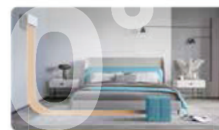
HORIZONTÁLNE PRÚDENIE VZDUCHU

Inovatívny 180° pohyb lamiel umožňuje prúdenie vzduchu v horizontálnom alebo vertikálnom smere. Táto možnosť vám umožní, aby nebol prúd vzduchu mierený priamo na vás.